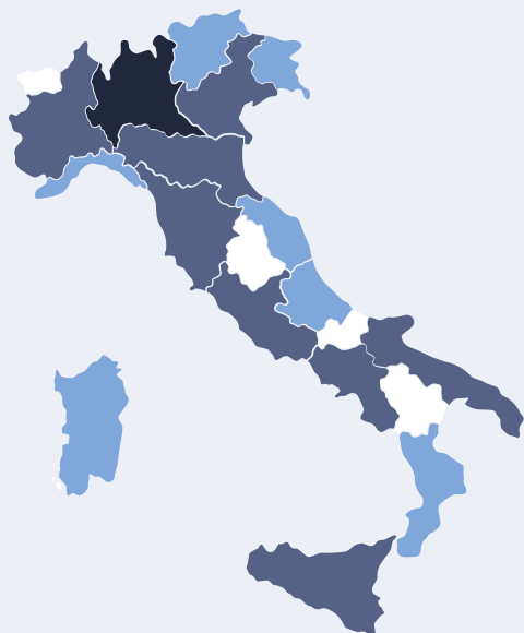
NUMEROSITÀ IMPRESE ISTAT 2023